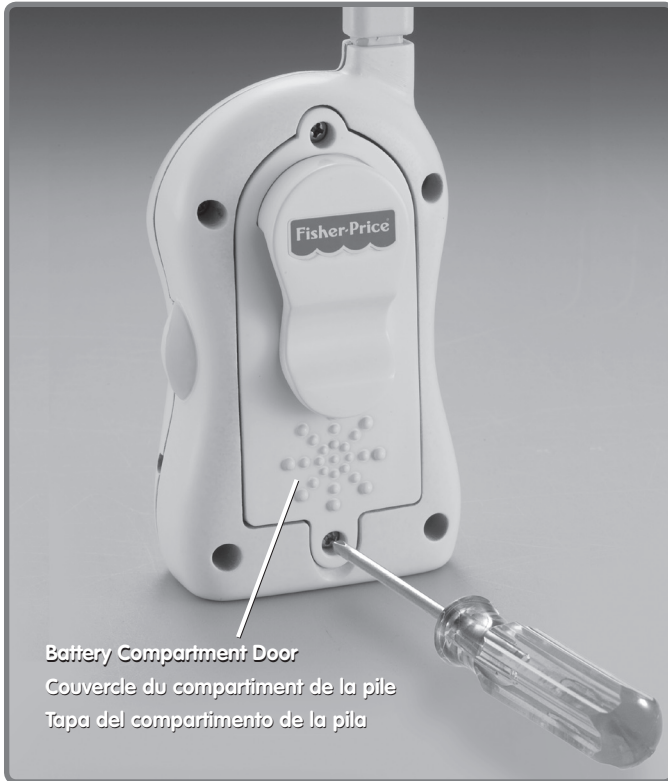
Battery Compartment Door Couvercle du compartiment de la pile Tapa del compartimento de la pila